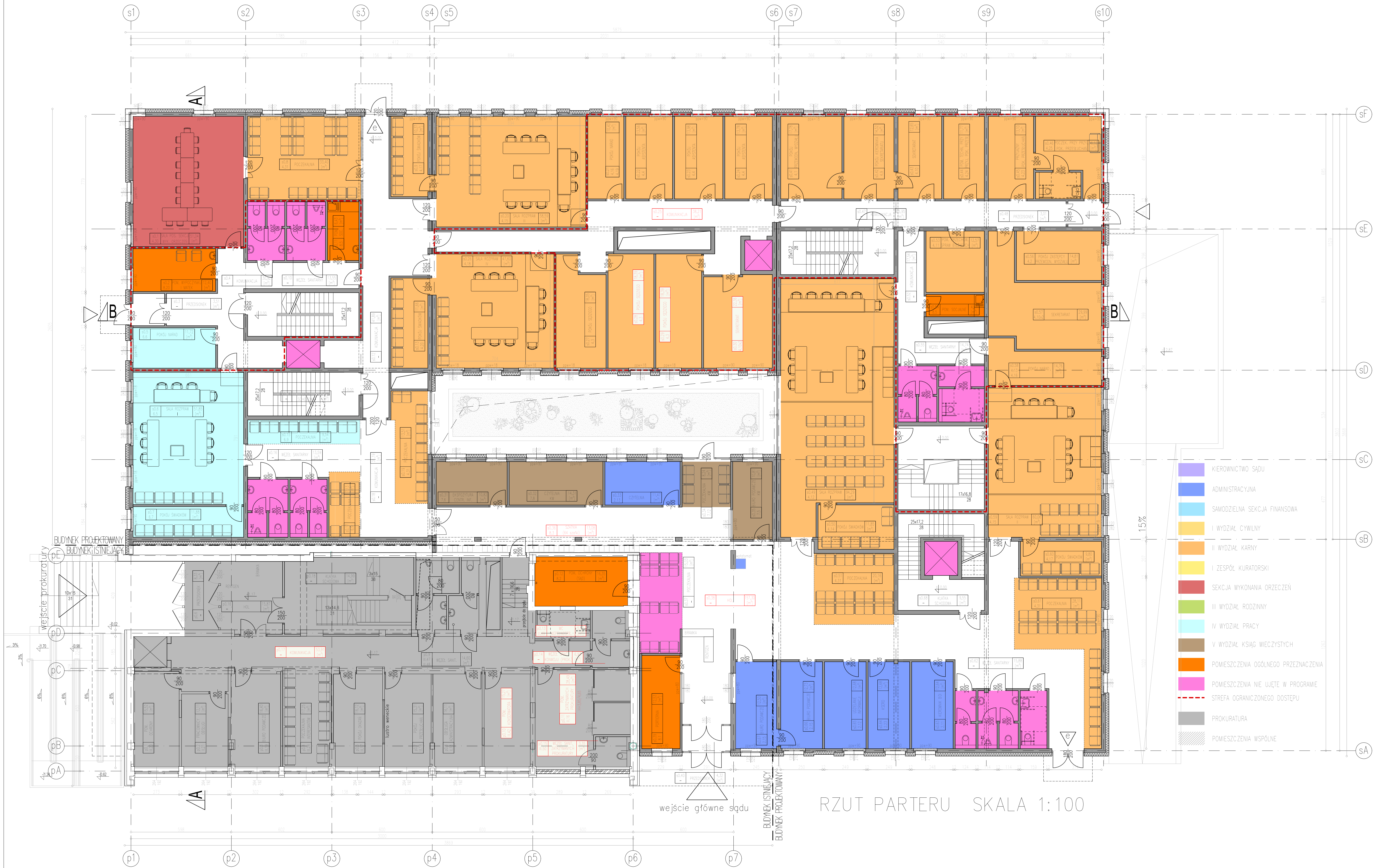
RZUT PARTERU SKALA 1:100